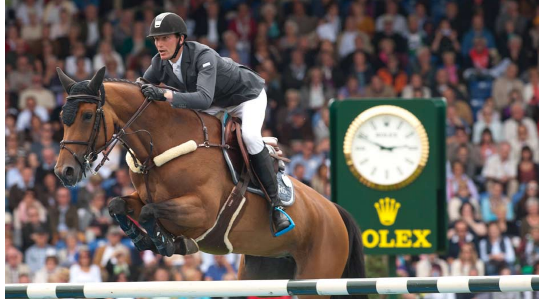
French Kevin Staut ranks among the world's greatest. The Rolex ambassador will also compete at the CHIO Aachen 2014.