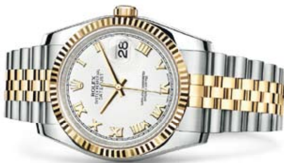
OYSTER PERPETUAL DATEJUST

THIS WATCH HAS SEEN VICTORIES EARNED. AND CHAMPIONS RISE.