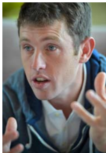
Scott Brash (on the right) presently is the world ranking list's number one. In second place: Ben Maher.